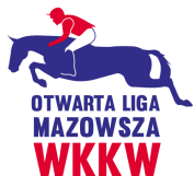
TABELA RANKINGOWA – 2016 OTWARTEJ LIGI MAZOWSZA W WKKW PO III ELIMINACJI Rozegranej 02-03.07.2016 r. w WKJ „Gabon” w Walewicach